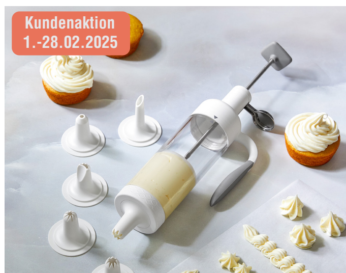
Garnierspritze „Easy“ #100260 | 32 € 24 €

Tipp: Auch toll für herzhaftes Cremes oder Schlagsahne! 💡