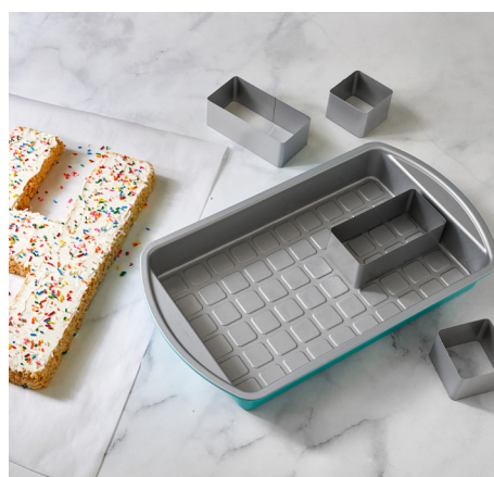
Kuchenform für Nummern und Buchstaben #100279 | 49,90 €