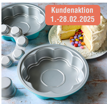
Überraschungskuchenform #100666 | 49,90 € 43 €