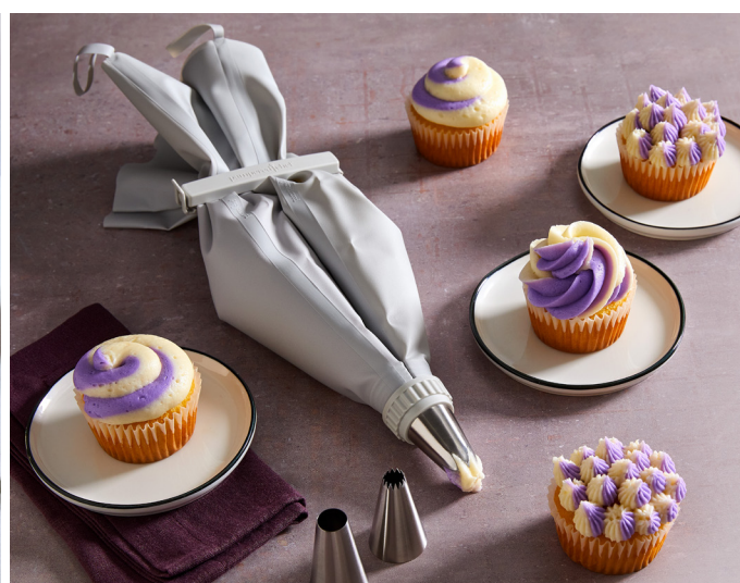
Dualer Spritzbeutel #100902 | 35 €