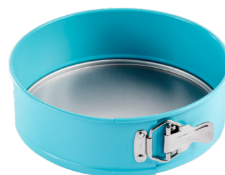
Springform, 23 cm #100596 | 31,90 €

Warum muss ein Kuchen immer flach liegen? Kinder stellen alles auf den Kopf. Dieser Regenbogen wird zum Kuchen-Highlight auf jedem Kindergeburtstag.