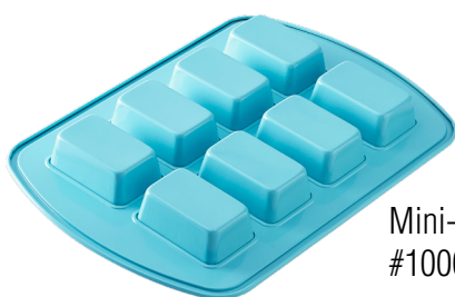
Mini-Kuchen #100020 | 27,50 €

Aus einfachen Rührkuchen- oder Biskuit-Schnitten werden mit Kuvertüre und bunten Streuseln leckere Kuchen-Lollis, z. B. mit unserer Backform Mini-Kuchen .