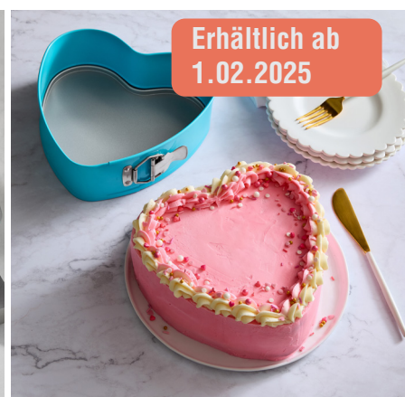
Herz-Backform #101427 | 29,90 €