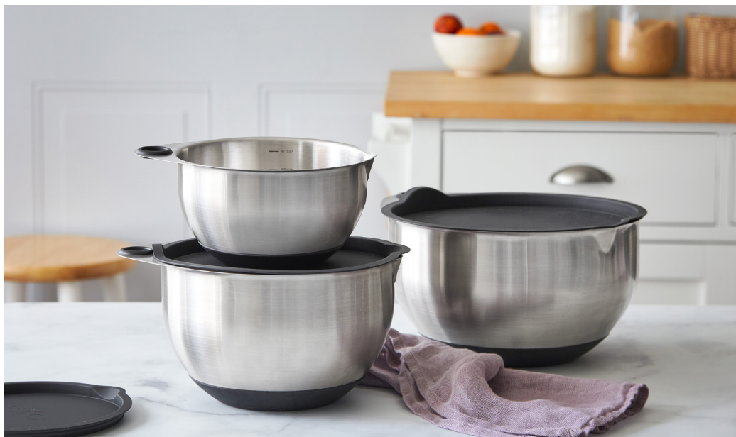
Edelstahl-Rührschüssel-Set #1735 | 109 €

Mit unseren Produkten kannst du individuelle Leckereien backen und deine Liebsten immer wieder überraschen .